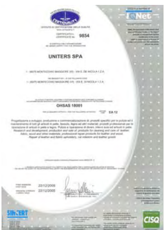
Zertifikat für Sicherheit und Schutz am Arbeitsplatz OHSAS 18001.