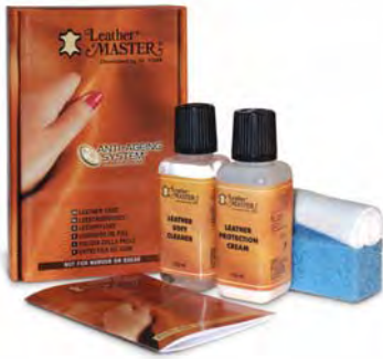
Verpackung à 24 Stück