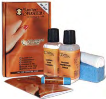
Verpackung à 24 Stück

Verfügbar mit Broschüren auf Englisch, Holländisch, Deutsch, Spanisch, Italienisch, Französisch, Finnisch, Portugiesisch, Türkisch, Ungarisch, Japanisch, Chinesisch, Russisch, Koreanisch, Slowenisch und Kroatisch.