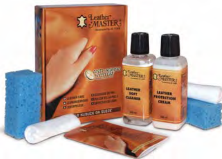
Verpackung à 24 Stück

Verfügbar mit Broschüren auf Englisch, Holländisch, Deutsch, Spanisch, Italienisch, Französisch, Finnisch, Portugiesisch, Türkisch, Ungarisch, Japanisch, Chinesisch, Russisch, Koreanisch, Slowenisch und Kroatisch.