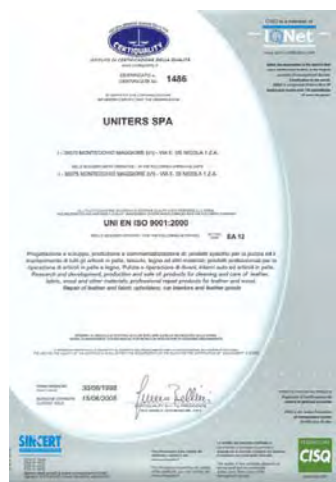
Qualitätszertifikat UNI EN ISO 9001.

2005 wurde UNITERS das Zertifikat für Sicherheit und Schutz am Arbeitsplatz OHSAS 18001 erteilt.