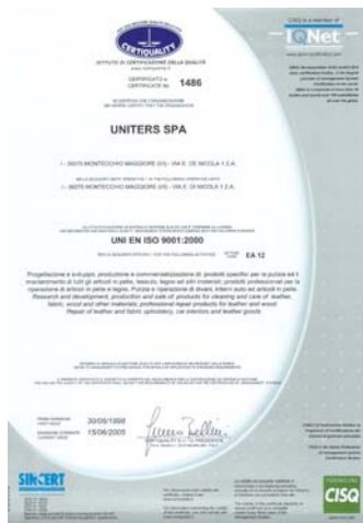
Qualitätszertifikat UNI EN ISO 9001.

2005 wurde UNITERS das Zertifikat für Sicherheit und Schutz am Arbeitsplatz OHSAS 18001 erteilt.