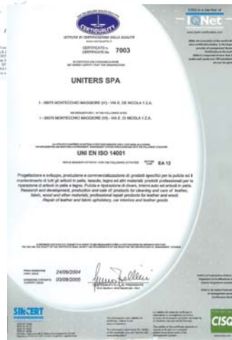
Umweltzertifikat UNI EN ISO 14001.