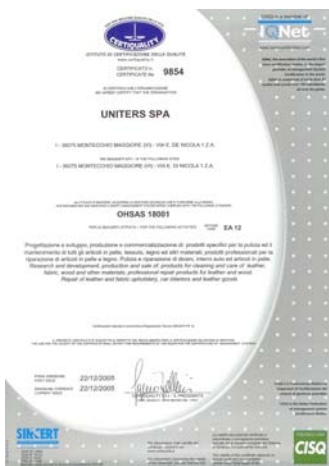
Zertifikat für Sicherheit und Schutz am Arbeitsplatz OHSAS 18001.